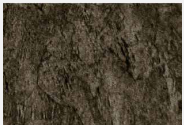
Struttura a grano fine della lega CuCrZr Luvata

Luvata Ohio Inc. 1376 Pittsburgh Drive Delaware Ohio 43015 USA Tel: +1 740 363 1981