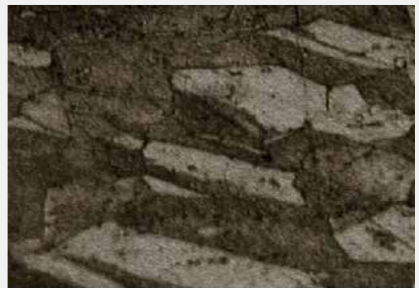
Struttura del grano tradizionale della lega CuCrZr